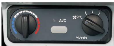
Tableau de bord digital frontal

Un puissant système de refroidissement/chauffage et six bouches d'aération fournissent un confort optimal pour les journées les plus froides d'hiver et les plus chaudes d'été.